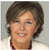
Mercedes Bresso Presidente della Regione Piemonte