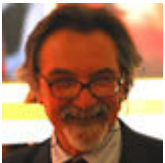
Guglielmo Pepe National Geographic Society