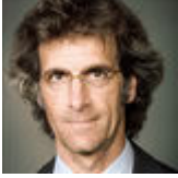
Guido M. Barilla Presidente Barilla Holding SPA